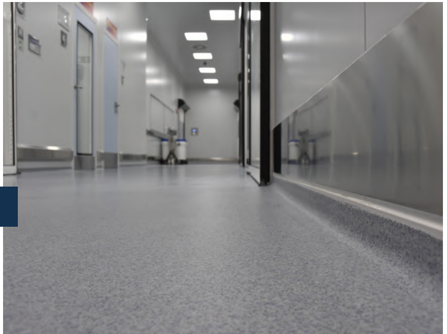
800 m 2 di Stonblend GSI